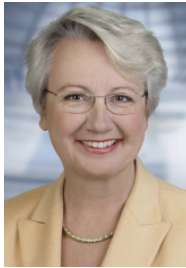
Grüßwort Annette Schavan

Bildung findet nicht allein in der Schule statt. Sie ist Aufgabe der ganzen Gesellschaft. Ein Land, das sich als Bildungsrepublik versteht, braucht viele engagierte Bürgerinnen und Bürger, die junge Menschen für Bildung begeistern und ihnen helfen, einen guten Weg ins Leben zu finden. Hierzu braucht es gute Ideen. Deshalb lädt das Bundesministerium für Bildung und Forschung zusammen mit der Initiative „Deutschland – Land der Ideen“ und der Vodafone Stiftung Deutschland zum dritten Mal zum Wettbewerb „Ideen für die Bildungsrepublik – Gemeinsam für mehr Bildungschancen“ ein.