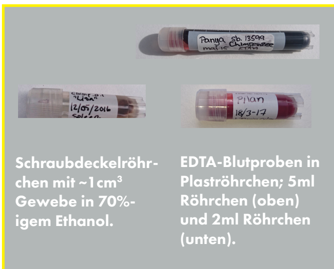
Schraubdeckelröhrchen mit ~1cm 3 Gewebe in 70%-igem Ethanol.

*: bitte eventuelle lokal geltende Ausnahmen beachten.